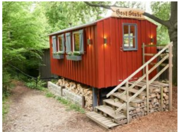
Die „Gast Stube“ der Raststätte Ilsestein